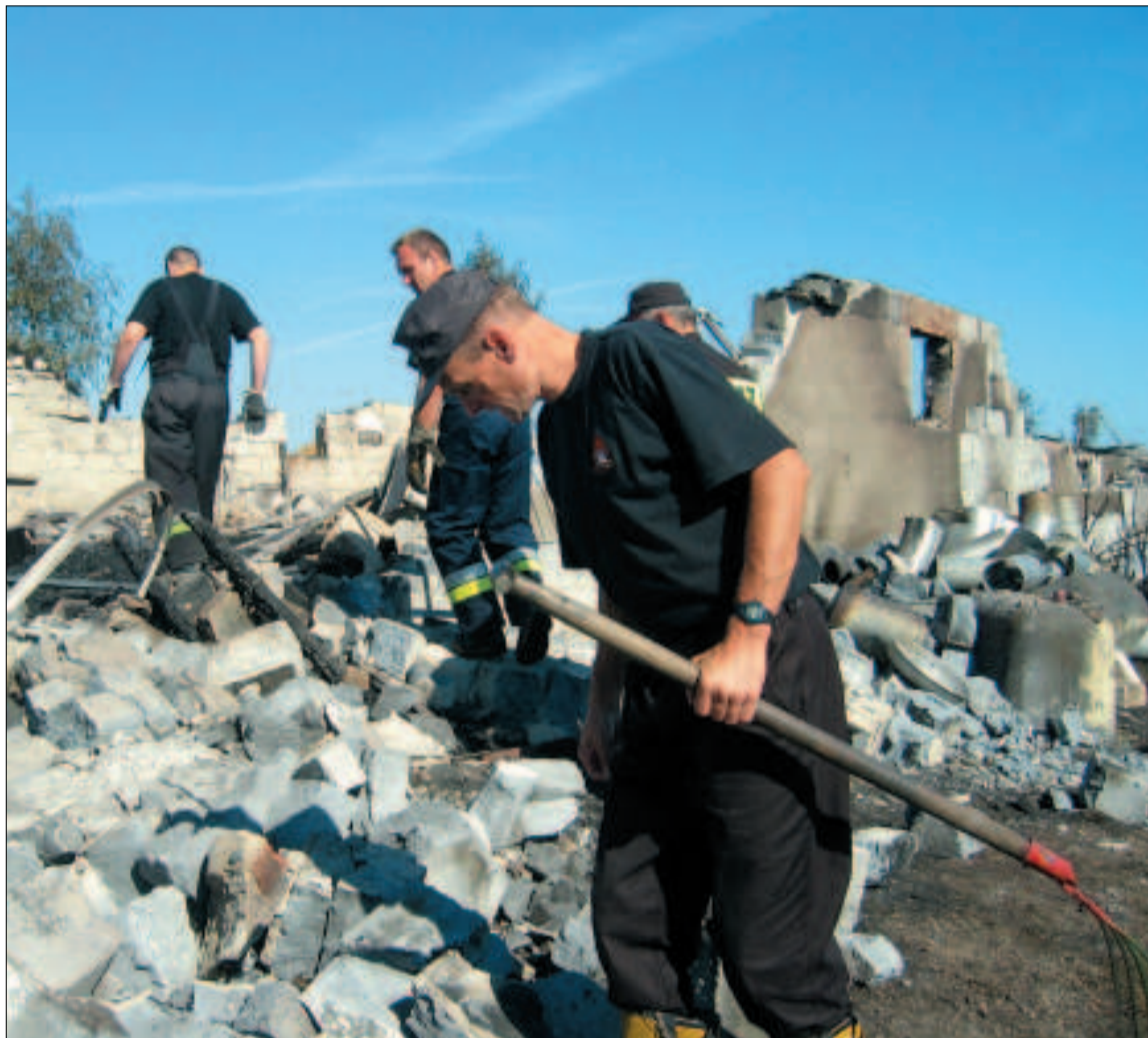
W tej chwili na miejscu obu pożarów, w Pomarzanach i Dobrzewach strażacy próbują ustalić przyczynę tak gwałtownego wybuchu ognia